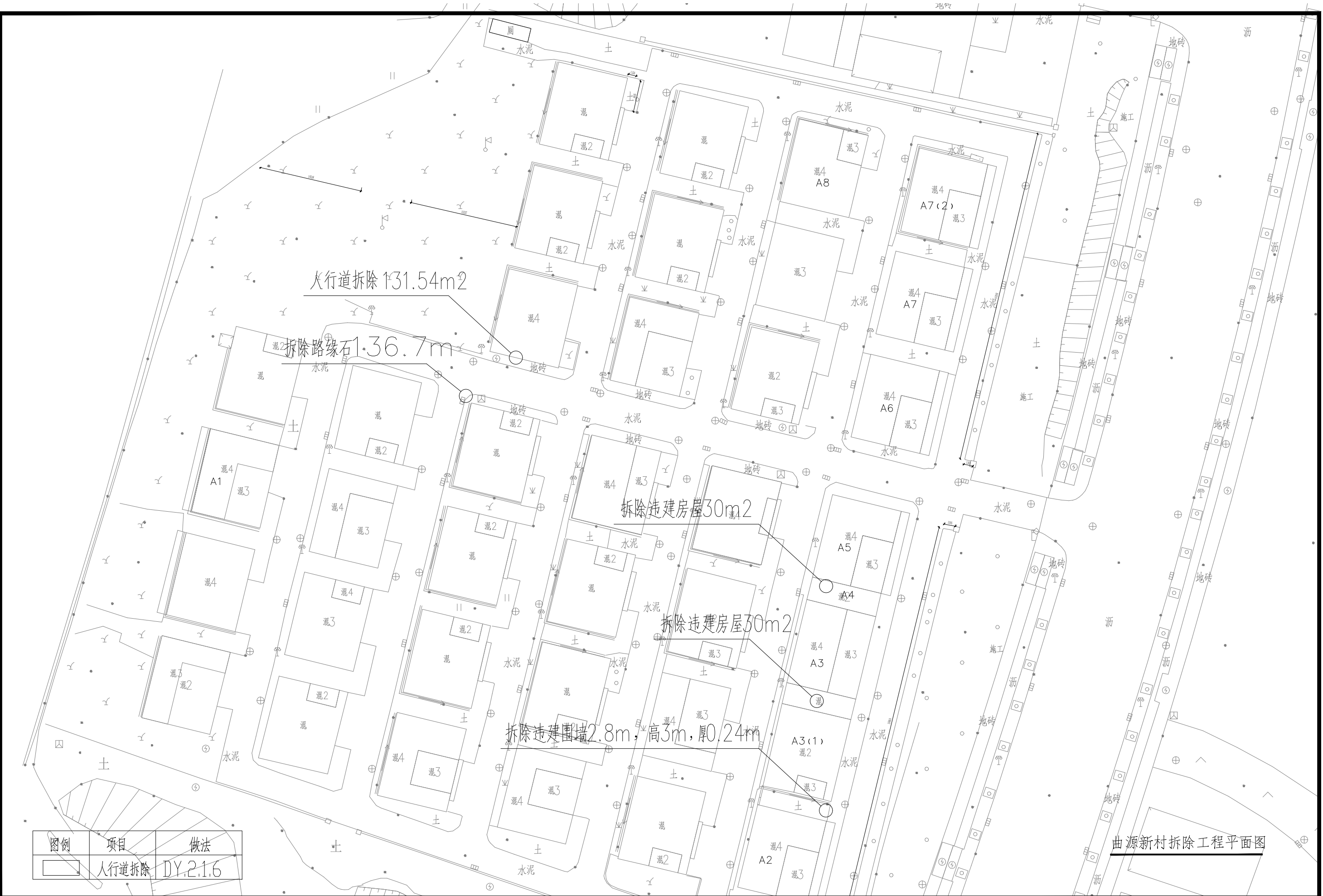
曲源新村拆除工程平面图